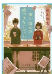
『僕と彼女の 嘘つきなアルバム』 高木 敦史／著 KADOKAWA