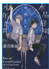
『水晶庭園の少年たち 3』 蒼月 海里／著 集英社