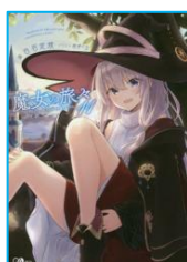
『魔女の旅々 11』 白石 定規／著 SBクリエイティブ