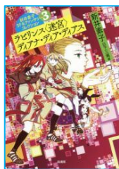
『新井素子SF& ファンタジー コレクション 3』 新井 素子／著