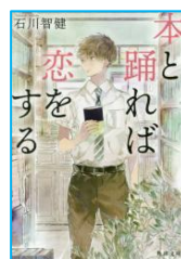
『本と踊れば恋をする』 石川 智健／著 KADOKAWA