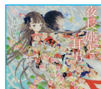
『夜長姫と耳男 (乙女の本棚)』 坂口 安吾／著 立東舎