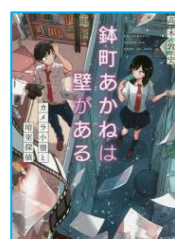
『鉢町あかねは 壁がある』 高木 敦史／著 KADOKAWA