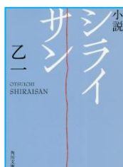
『小説シライサン』 乙一／著 KADOKAWA