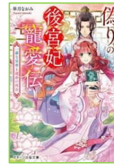
『偽りの後宮妃寵愛伝』 皐月 なおみ／著 スタート出版