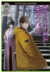
『ホーンテッド・ キャンパス 20』 榎木 理宇／著 KADOKAWA