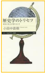
『歴史学のトリセツ (ちくまプリマー新書)』 小田中 直樹／著 筑摩書房