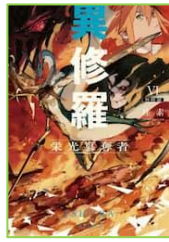
『異修羅 6』 珪素／著 KADOKAWA