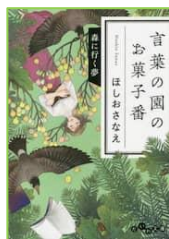
『言葉の園の お菓子番 3』 ほしお さなえ／著 大和書房