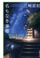
『名もなき本棚』 三崎 亜記／著 集英社