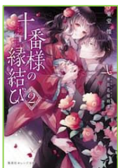
『十番様の縁結び 2』 東堂 燦／著 集英社