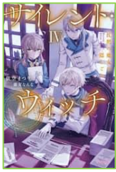
『サイレント・ ウィッチ 4』 依空 まつり／著 KADOKAWA