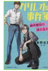
『ガリレオの事件簿 2』 東野 圭吾／著 文藝春秋