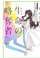
『生命の略奪者 (天久鷹央の 事件カルテ8)』 知念 実希人／著 新潮社