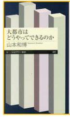
『大都市は どうやってできるのか (ちくまプリマー新書)』 山本 和博／著 筑摩書房