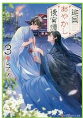
『迦国あやかし 後宮譚 3』 シアノ／著 アルファポリス