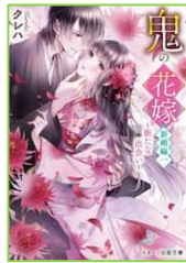
『鬼の花嫁 新婚編1』 クレハ／著 スタート出版