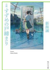
『小説 すずめの戸締まり』 新海 誠／著 KADOKAWA