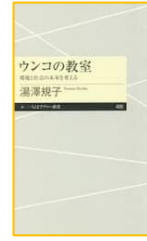
『ウンコの教室 (ちくまプリマー新書)』 湯澤 規子／著 筑摩書房