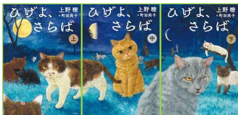
『ひげよ、さらば 上・中・下巻』 上野 瞭／著 理論社