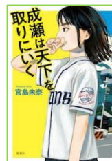
『成瀬は天下を 取りに行く』 宮島 未奈／著 新潮社