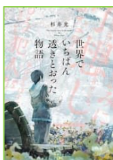
『世界でいちばん 透きとおった物語』 杉井 光／著 新潮社