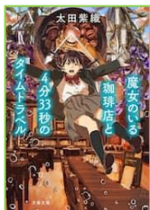
『魔女のいる珈琲店と 4分33秒の タイムトラベル』 太田 紫織／著 文藝春秋