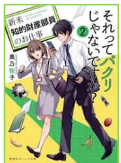
『それってパクリじゃ ないですか？ 2』 奥乃 桜子／著 集英社