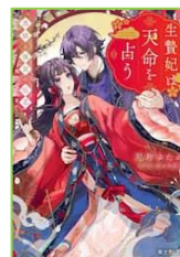
『生贄妃は 天命を占う』 尼野 ゆたか／著 KADOKAWA