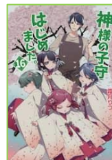
『神様の子守 はじめました。16』 霜月 りつ／著 コスミック出版