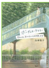
『ボーダレス・ ケアラー』 山本 悦子／著 理論社