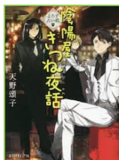
『よろず占い処陰陽屋 きつね夜話 (よろず占い処陰陽屋 シリーズ スピンオフ)』 天野 頌子／著 ポプラ社