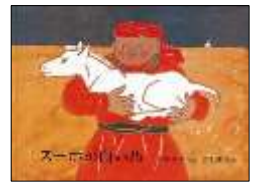
『スーホの白い馬』 大塚 勇三/再話 赤羽 末吉/画 福音館書店

『だいくとおにろく』や『かさじぞう』など、子どもの頃に読んだ懐かしい作品を読み返してみたいかですか。