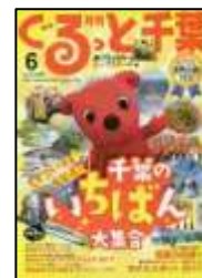
『ぐるっと千葉』 ちばマガジン

雑誌につきましては、最新号は館内での閲覧のみとなり、貸出しはできません。雑誌バックナンバーコーナーにある雑誌は貸出しできますので、ぜひご利用ください。