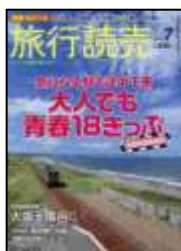
『旅行読売』 旅行読売出版社