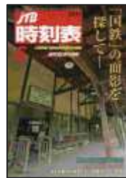
『JTB時刻表』 JTBパブリッシング