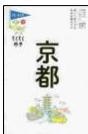
『京都 ブルーガイド てくてく歩き』 実業之日本社