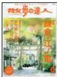
『散歩の達人』 交通新聞社