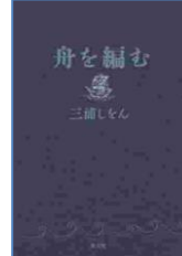
『舟を編む』 三浦しをん／著 光文社