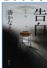
『告白』 湊かなえ／著 双葉社