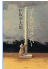
『ゴールデンランパー』 伊坂幸太郎／著 新潮社