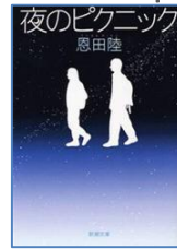
『夜のピクニック』 恩田陸／著 新潮社