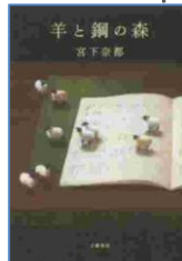
『羊と鋼の森』 宮下奈都／著 文芸春秋

『かがみの孤城』と『蜜蜂と遠雷』には多数の予約が入っています。提供が遅くなることを、あらかじめご了承ください。