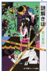
『謎解きはディナーのあとで』 東川篤哉／著 小学館