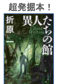
『異人たちの館』 折原一／著 文芸春秋

※大久保図書館では本屋大賞ノミネート作品の展示を行っております。 (展示期間：7月7日～8月2日)