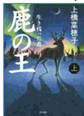
『鹿の王 上下』 上橋菜穂子／著 KADOKAWA