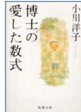
『博士の愛した数式』 小川洋子／著 新潮社