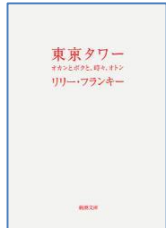
『東京タワー』 リリー・フランキー／著 扶桑社