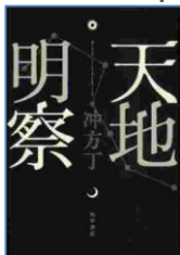
『天地明察』 冲方丁／著 角川書店