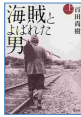
『海賊とよばれた男 上下』 百田尚樹／著 講談社