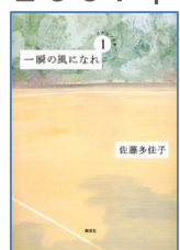
『一瞬の風になれ(全3巻)』 佐藤多佳子／著 講談社