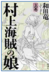
『村上海賊の娘 上下』 和田竜／著 新潮社