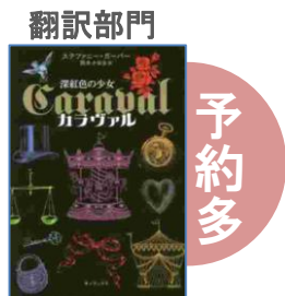
『カラヴァル』 ステファニー・ガーバー／著 キノブックス

本屋大賞では、2012年から「翻訳部門」が、2016年からは「超発掘本！」が設立されました。2018年は、右の2冊が選ばれました。