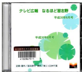
習志野市／企画・著作

ケーブルテレビで放送している広報番組です。ビデオ版は平成10年10月放送分から平成23年3月放送分まで、DVD版は平成17年4月放送分から現在まで所蔵しています。放送の翌月からの貸し出しになります。