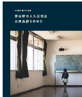
日々是好日／企画・撮影・編集