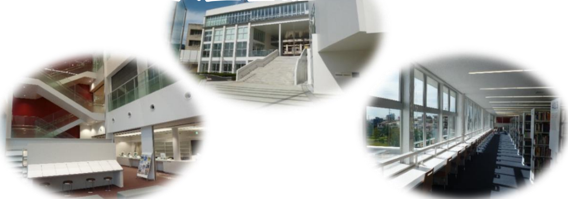
上: プラッツ習志野北館外観 左: 中央図書館2階ラウンジ 右: 4階公園側閲覧席

令和元年11月2日、習志野市の新しい生涯学習施設「プラッツ習志野」内に中央図書館が開館します。中央図書館は京成大久保駅から徒歩2分の場所にあり、夜8時まで開館しているとても便利な図書館です。また、4階にある閲覧室からは、緑豊かな公園を眺めながら読書を楽しむことができます。今回は中央図書館のサービスの一部をご紹介します。皆様のたくさんのご利用をお待ちしております。