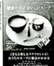
『絵本の中のおいしいスープ』 主婦と生活社

もう1冊、心もあたたかくなるスープの本はいかが？『絵本の中のおいしいスープ』絵本の中から飛び出した夢のスープを食べてみたくないですか？ (つゆ…れん)