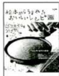
『絵本からうまれたおいしいレシピ』 主婦と生活社

小さい頃読んだあの本にでてくるお菓子は、なんておいしそうなんだろう。一度でいいから食べてみたいー！なんて思ったことありませんか？わたしはおいしいもの食べたーい派なので、読むたび思ってしまうんです。そんな風に思う人が多いのか