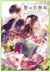
『贄の白無垢』 高橋 由太／著 宝島社