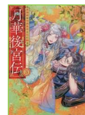
『月華後宮伝 3』 織部 ソマリ／著 アルファポリス