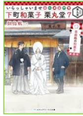
『いらっしゃいませ 下町和菓子 栗丸堂 7』 似鳥 航一／著 KADOKAWA