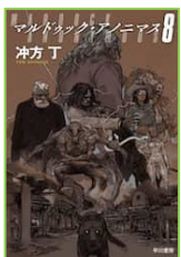
『マルドゥック・ アノニマス 8』 冲方 丁／著 早川書房