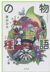
『物語の種』 有川 ひろ／著 幻冬舎