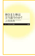
『神さまと神は どう違うのか?』 (ちくまプリマー新書)』 上枝 美典／著 筑摩書房