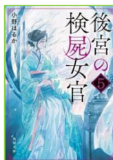
『後宮の 検屍女官 5』 小野 はるか／著 KADOKAWA