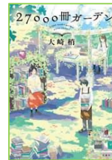
『27000冊ガーデン』 大崎 梢 双葉社