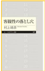
『客観性の落とし穴 (ちくまプリマー新書)』 村上 靖彦／著 筑摩書房