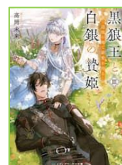
『黒狼王と白銀の贅姫 3』 高岡 未来／著 KADOKAWA