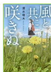
『風と共に咲きぬ』 清水 晴木／著 KADOKAWA