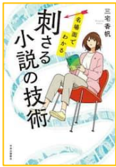
『名場面でわかる 刺さる小説の技術』 三宅 香帆／著 中央公論新社