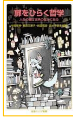
『扉をひらく哲学 (岩波ジュニア新書)』 中島 隆博／ほか編著 岩波書店