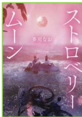
『ストロベリームーン』 芥川 なお／著 すばる舎