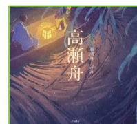
『高瀬舟 (乙女の本棚)』 森 鷗外／著 立東舎