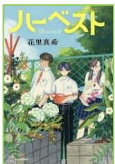
『ハーベスト』 花里 真希／著 講談社