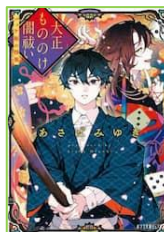
『大正もののけ 闇祓い』 あさば みゆき／著 ポプラ社