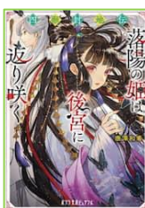
『四獣封地伝』 唐澤 和希／著 ポプラ社