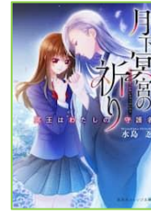
『月下冥宮の祈り』 水島 忍／著 集英社