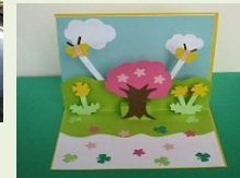
参加者の方の作品

2月28日(土)に「親子でポップアップカードを作ろう」を開催しました。親子で協力して、とても素敵なカードが出来上がりました！